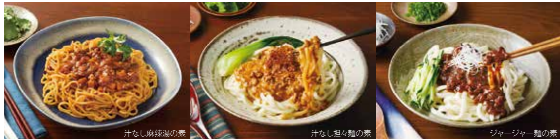
汁なし麻辣湯の素

NEW 「具材感」「調理感」のある、うどん等の麺にかける本格ソース。国産豚肉を使用のうまみあふれるソースです。